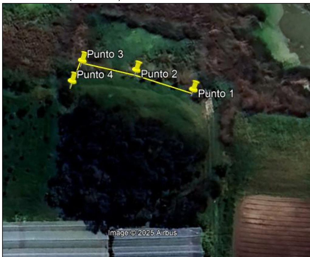
Ilustración 1. Recorrido

Con base en lo anterior, el día 01 de Julio de 2025 se realizó recorrido de control y vigilancia en el humedal Gualí desde las coordenadas 4°44'52,506" N-74°13'11,286" W hasta las coordenadas 4°44'54,012"N-74°13'11,796"W (ver ilustración 1. Ruta amarilla) Vereda Cacique, ecosistema que fue declarado por la Corporación Autónoma Regional de Cundinamarca - CAR como Distrito Regional de Manejo Integrado a través el acuerdo 001 de 2014 "Por medio del cual se declaran como Distrito Regional de Manejo Integrado (DMI), los terrenos comprendidos por los humedales de Gualí, Tres Esquinas y Lagunas de Funzhé, y su área de influencia directa ubicada en los municipios de Funza, Mosquera y Tenjo, Cundinamarca", y estableció tres zonas: 1. Preservación (espejo de agua), 2. Recuperación (50 metros) y 3. Uso sostenible (100 metros).